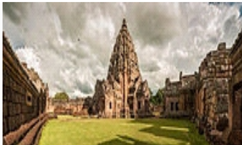
Prasat Phnom Rung, the site of an ancient Khmer city