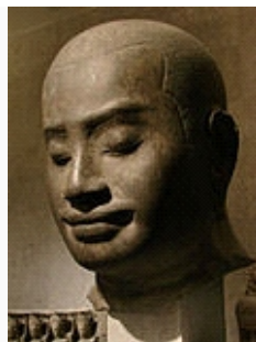
Portrait statue of Jayavarman VII