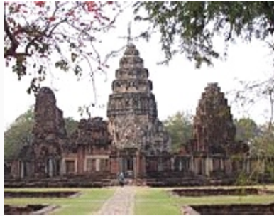
Phimai, the site of an ancient Khmer city of Vimayapura

contribution to the prosperity and power of Kambuja the declining harvests further weakened the empire.