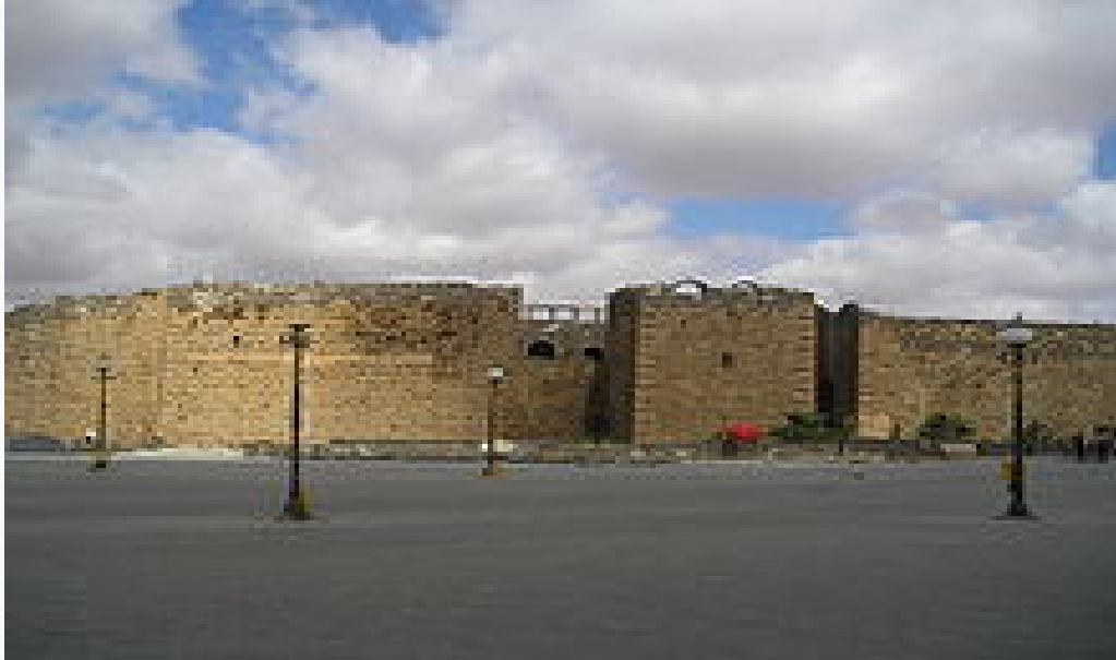
A view of the citadel in Bosra (the theater is located inside)

gradually less prominent during the Ottoman era. Today, it is a major archaeological site and has been declared by UNESCO as a World Heritage Site .