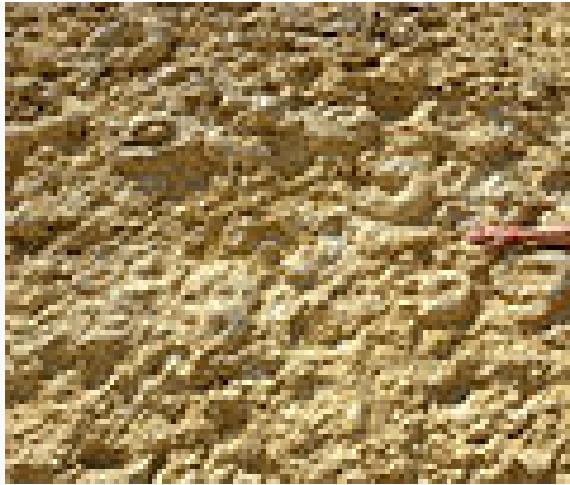
Ammonite Wall in Makhtesh Ramon (Tamar Formation, Cenomanian ).